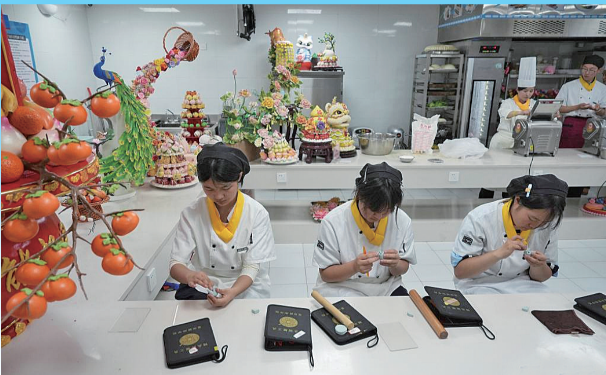
图为学生在蓝田厨师学校实训室内练习制作糕点。