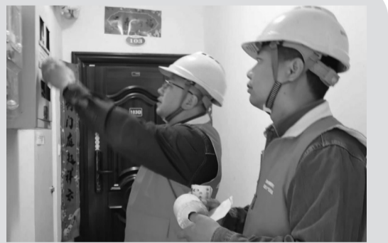
安全用电、防灾避险意识,拉近了党群干群距离。下一步,国网洛南县供电公司常态化开展进社区、进乡村、进企业便民服务,紧盯群众急难愁盼,送上精准暖心的电力保障,守护千家万户平安用电,彰显国企责任与担当。

家用电隐患。恰逢全国防灾减灾日,队员们向过往居民发放安全用电和应急避险宣传资料,用通俗易懂的语言,讲解家庭防火、触电急救、雷雨天气安全用电、灾害应急处置等实用知识。手把手指导居民使用“网上国网”APP,实现电费缴纳、故障报修、业务咨询线上办理,让大家少跑腿、更省心。考虑到小区老年住户较多,服务队主动上门走访独居、高龄老人家庭,仔细检查室内用电设施,认真解答用电疑问,用心守护老年群体用电安全。此次志愿服务,充分发挥党员先锋模范作用,切实打通电力服务“最后一百米”,有效提升居民