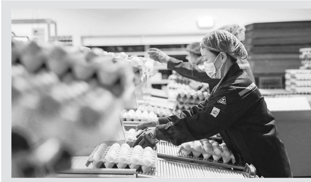
近日,旬邑黄马甲农业科技有限公司分拣车间内,工作人员正对鸡蛋进行分级包装。作为旬邑县重点农业产业化项目标杆企业,该公司一期总投资6亿元,占地422.23亩,配套建设现代化鸡舍及蛋品、辅料、制肥、成品等车间,构建起集生态养殖与精深加工于一体的现代农业产业体系。