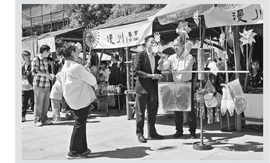
近日,山阳县漫川关古镇热闹非凡,景区推出漫川集市、花轿巡游等活动,让游客沉浸式感受秦风楚韵的古镇风情,丰富特色的文旅项目,有效激活假日旅游消费。