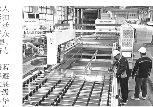
在陕西煌朝真空玻璃科技有限公司生产车间,工人们正在进行真空玻璃生产。

洛南县从严推进涉秦岭、黄河生态环境保护问题整改,打好秦岭矿山整治收官战,年内将全县矿山压减至50个以内,在产大中型矿山绿色化建设实现100%,完成造林绿化9万亩以上。持续深化污染防治,确保全年空气质量优良天数达348天以上,洛河出境断面水质稳定达标,实施15个以上VEP项目,丰富“生态贷”金融产品,拓宽生态价值转换路径,让