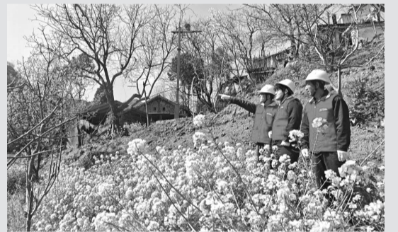
现场为农户讲解安全用电知识,避免因用电不当造成生产损失。

国家电网陕西电力张思德(宝鸡陇县)共产党员服务队分台区走访重点养殖基地和家庭牧场,仔细检查圈舍保温、温控系统、饲料加工机械等关键用电设备,了解负荷变化与用电需求,协助排查整改线路设备隐患30余处。此外,该公司建立24小时应急联络机制,随时响应养殖户用电突发故障,助力养殖户稳