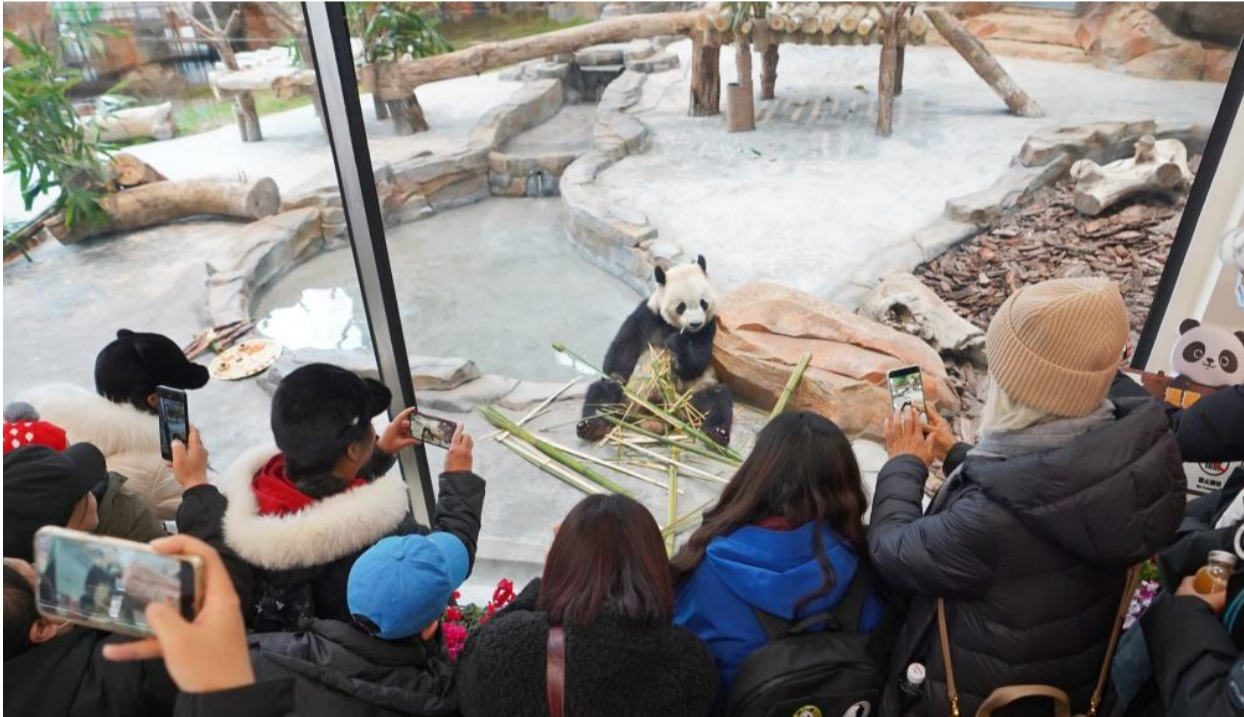
春节期间,来自中国大熊猫保护研究中心的两只大熊猫“宝元”和“德瑞”,经过一段时间的适应,在乌鲁木齐市水上乐园动物园(大熊猫馆)亮相,为各族群众的新春假期增添色彩。