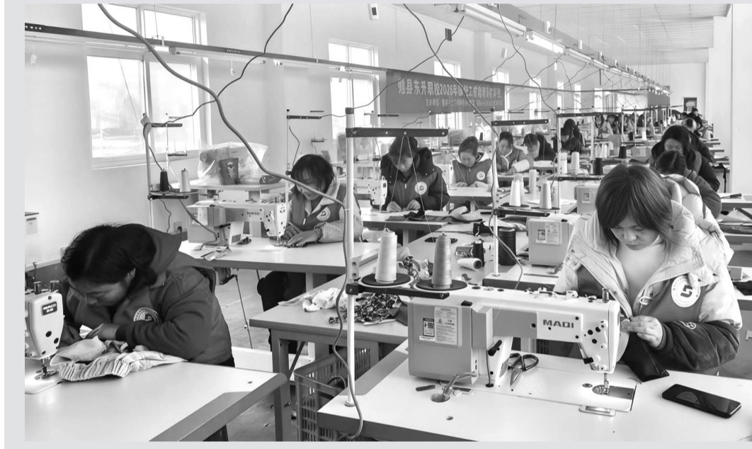
近日,勉县阜川镇福川社区以“授课+实操”模式,开展首期缝纫工培训,帮助学员快速适应社区服装厂岗位需求。2025年以来,该镇开展各类就业技能培训5次,培训220人次,带动周边闲散劳动力就业180人。