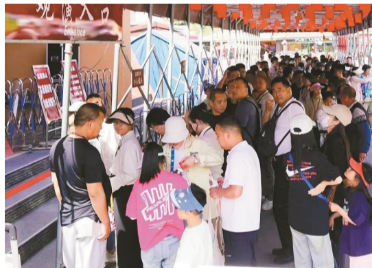
游客排队等待欣赏《复活的军团》演出。

形成“吃住行游购娱”一体化全业态产业链,让游客通过体验农事活动、户外拓展、亲子互动等,感受地道的乡土文化。