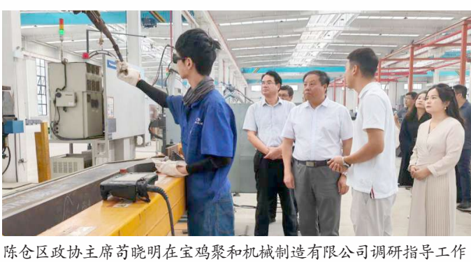
陈仓区政协主席苟晓明在宝鸡聚和机械制造有限公司调研指导工作