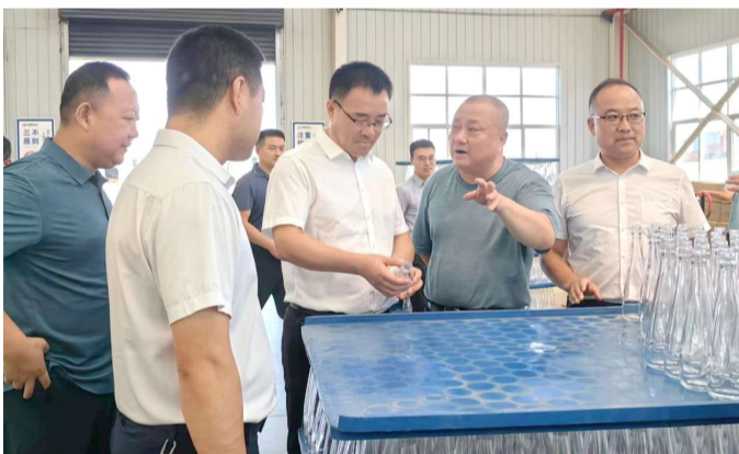
陈仓区委书记马霄在宝鸡祥腾骏达玻璃制造有限公司调研指导工作